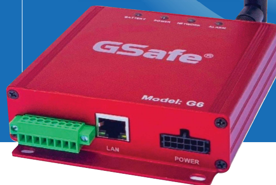
Thiết bị GSAFE Model G6